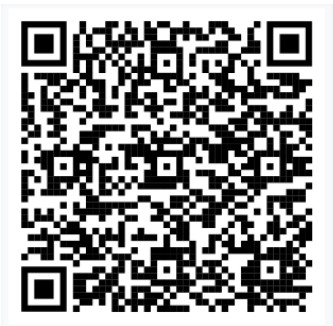
Сводный план-график проведения публичных обсуждений результатов правоприменительной практики территориальных органов федеральных органов исполнительной власти по Самарской области на 2023 год